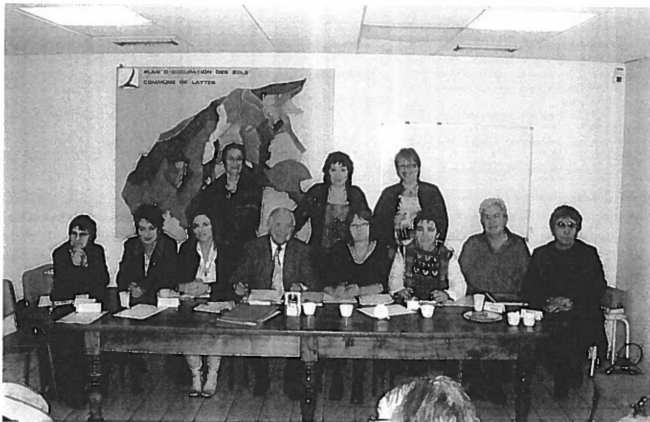
Le nouveau bureau élu à l'Assemblée générale du 21 janvier 2007

Bulletin de liaison et d'information de l'Association des Sophromagnétiseurs A.D.S.